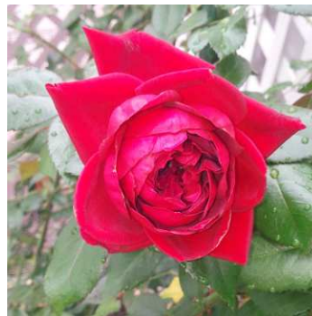
昨年のリパブリック

昨年から、つるバラを何本か栽培しています。冬の間、前年に伸びた枝を剪定し誘引しなければなりません。バラ栽培の本を参考にしながら剪定・誘引するのですが、思ったより時間のかかるものでした。ご存知の通り、鋭い棘のある植物なので、絡まりあった枝をほどいて、分類するのだけでも一苦労でしたが、一年目でこんな感じなので、二年目以降はもっと大変な気がします。