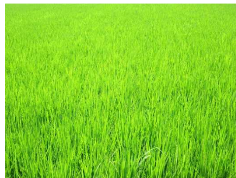
田の緑がもっとも美しい季節ですね