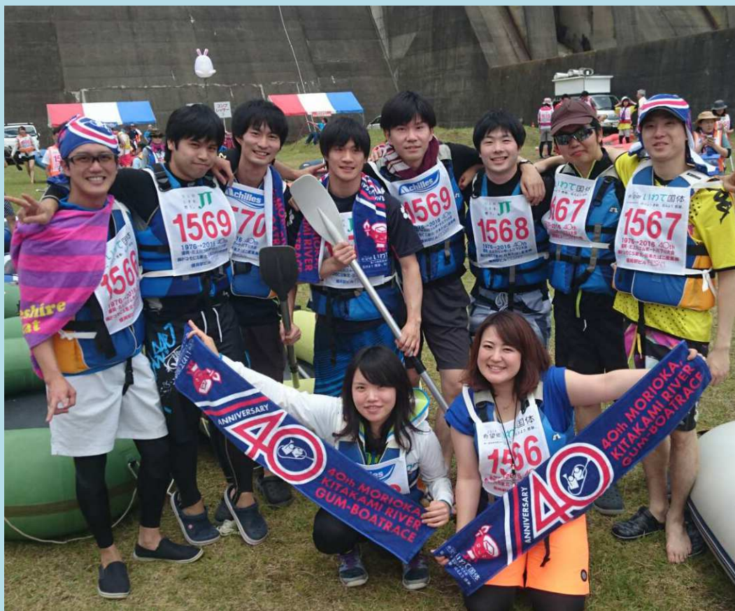
盛岡・北上川ゴムボート川下りの参加者