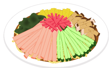
さっぱりとした麺類が食べたい季節です。