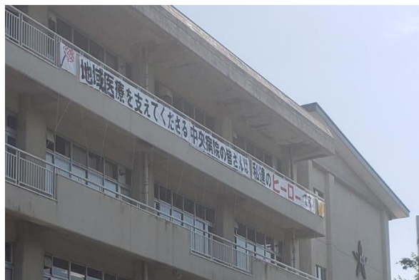
上田中学校で掲げていただいた横断幕

上田中学校様は、この度、2月に盛岡市教育委員会から、児童生徒表彰「善行の部」で表彰されたと伺っております。発想もさることながら、実行力が素晴らしいですね。心より、お祝い申し上げます。